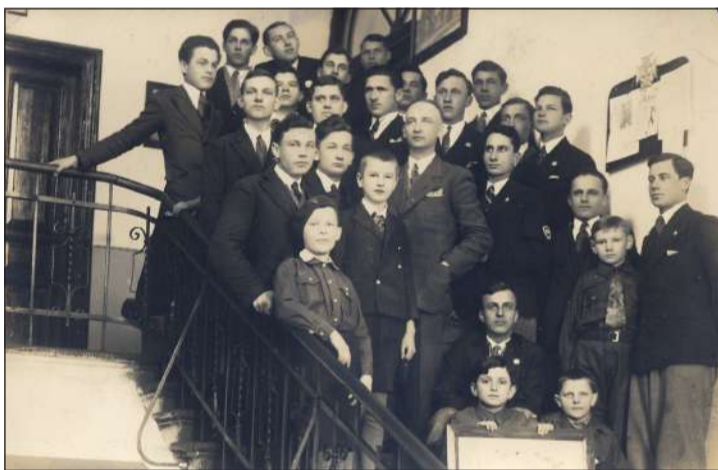
Учньове Семинарії в Кросні. 1930-и рр.