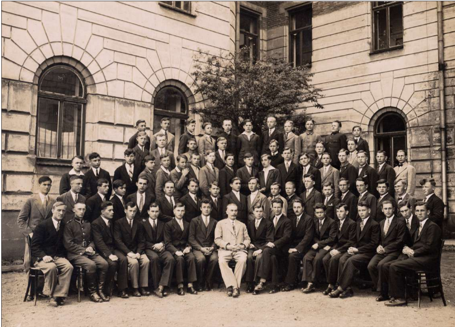
Учньове і професори Державной Наuczительской Семинарії в Кросні. 1939 р.